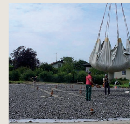
Solespeicher für Wärmepumpe

Fax an +49-(0)96 33-40 07 69-19 +43-(0)50 106-80